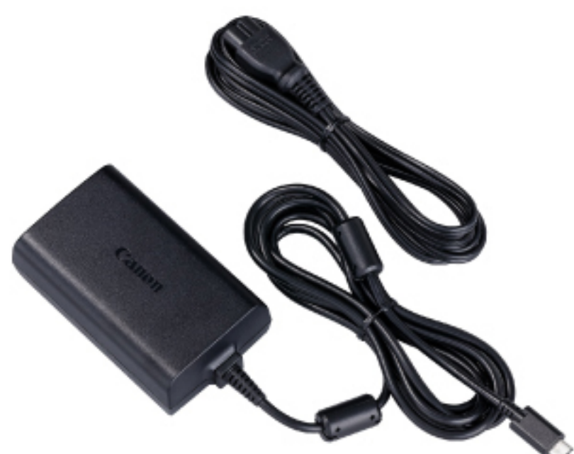
PD-E1 USB POWER ADAPTER

ตัวช่วยนัก Live ที่ทำให้เราชาร์จกล้องจากที่บ้านได้โดยตรง (Quick Charger)