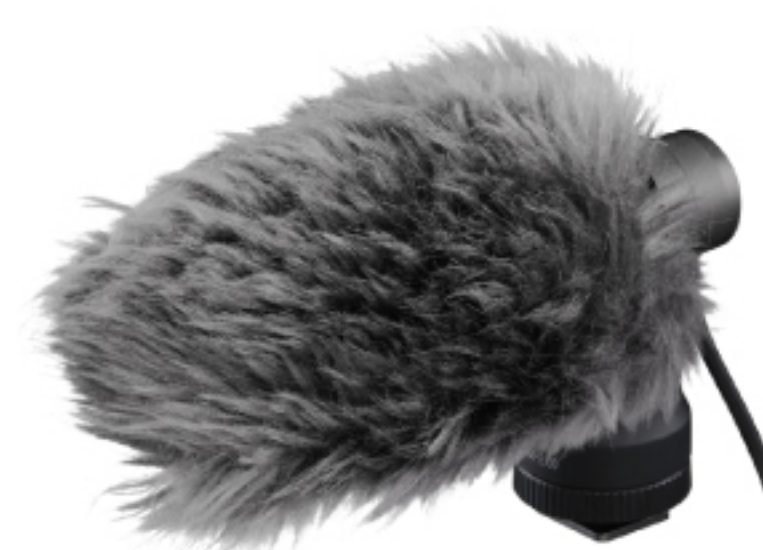
DM-E100 EXTERNAL MICROPHONE

ไมโครโฟน Shotgun เวอร์ชันจัดเต็มแบบ Stereo ที่รับเสียงได้ทั้งแนวตรง, มุม 90° และ 120° เหมาะแก่การใช้งานทุกสถานการณ์