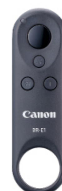
BR-E1 BLUETOOTH REMOTE CONTROLLER

ขาตั้งกล้องที่เกิดมาเพื่อ Vlog พร้อมตัวจับไมโครโฟน หมุนได้หลายองศา ยืดหยุ่นคล้องตัว มาพร้อมรีโมทคอนโทรล BR-E1