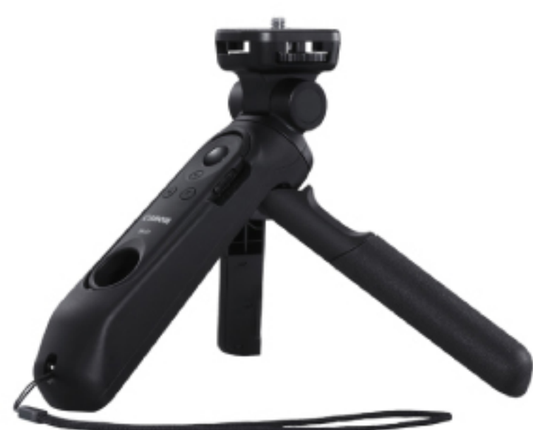
HG-100TBR TRIPOD GRIP

ไมโครโฟนสเตอริโอ ตัวเล็กกระทัดรัด พร้อมขมกรองเสียง ที่ให้น้ำหนักเบาใช้งานง่าย เข้ากับการถ่าย Vlog เป็นที่สุด