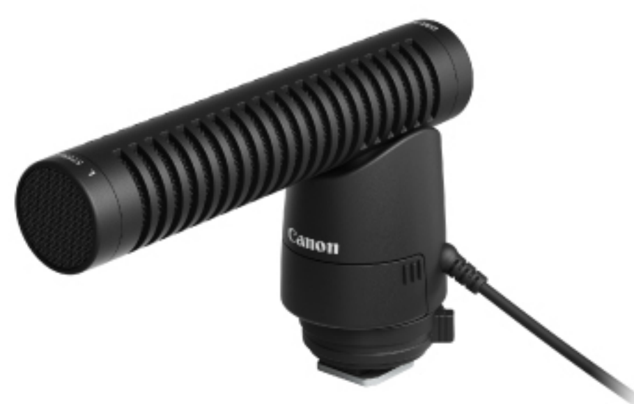
DM-E1 EXTERNAL MICROPHONE

ตัวช่วยนัก Live ที่ทำให้เราชาร์จกล้องจากที่บ้านได้โดยตรง (Quick Charger)